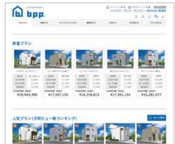
▲ 建築家が設計した380プランを様々な形で検索できるBPP

ここまでADMについて興味を持っていただきましたら、次のステップではBPP(ブループリントプロジェクト)を使って市場に出ている土地に当てはまる複数のプランをご紹介します。もともと決まった間取りからしか選べないと思っていたお客様にとっては、複数のプランから選べることを非常に喜ばれます。