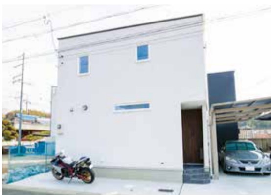
▲ ADM OB宅外観

ADMでは営業から設計打ち合わせにかかる手間が、注文住宅に比べて大幅に減ります。お客様はあらかじめ決まっているプランの中から好みのプランを選ぶことになるので、何度も打ち合わせが必要がありません。しかもプランは建築家が練りに練った多彩なプランで、なおかつ高性能住宅。デザイン性も高くしかも高性能住宅が1600万円台で実現する。そんな住宅はこれまでの住宅業界ではないと思います。お客様の満足度も非常に高い住宅です。